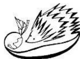
Рисунок, иллюстрирующий раздельный сбор мусора, из пособия «Эко-школы. Как получить Зелёный флаг в России», изданного в 2003 г., в первый год проведения программы в России. Автор иллюстр. — О.В. Орфинская.

Методология программы основывается на семи шагах , разработанных на основе стандартов ISO 14001/EMAS.